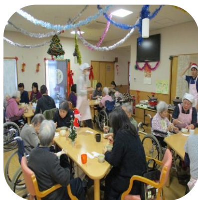
【クリスマス会（もみじ）】