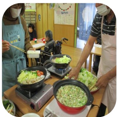
【クリスマス会（あやめ）】

家族の皆様におかれましては、ご多忙の中、クリスマス会にご参加頂き、ありがとうございました。