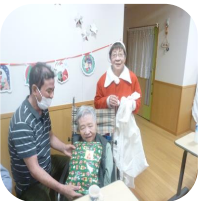
【クリスマス会（あやめ）】