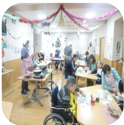
【クリスマス会（あやめ）】