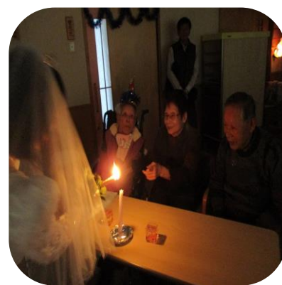
【クリスマス会（さくら）】

また、利用者の皆さんと家族の皆さんと一緒に歓談しつつ、会食やクリスマスのイベントを楽しまれたことは、良い思い出として、心の中に綴られたのではないのでしょうか。