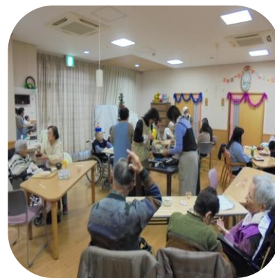
【クリスマス会（さくら）】