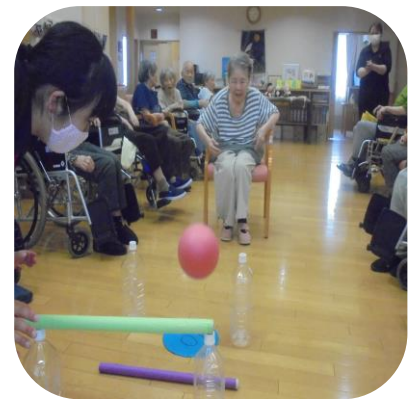
【レクリエーション】