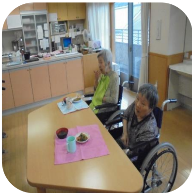
【ホットプレート調理（もみじ）】

夏祭りでは、縁日にちなみ、射的やヨーヨー釣りを楽しんでいただきました。ヨーヨー釣りでは、ひっかけることが難しかったですが、釣り上げると、皆様良い表情を見せられました。職員もつられて嬉しくなっていました。また、レク活動でも、塗り絵を真剣にされています。