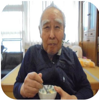
【おやつ作り（もみじ）】