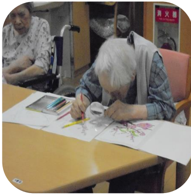
【塗り絵作成（あやめ）】