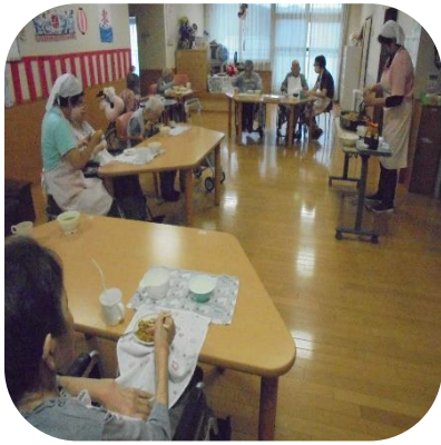
【ホットプレート調理（あやめ）】