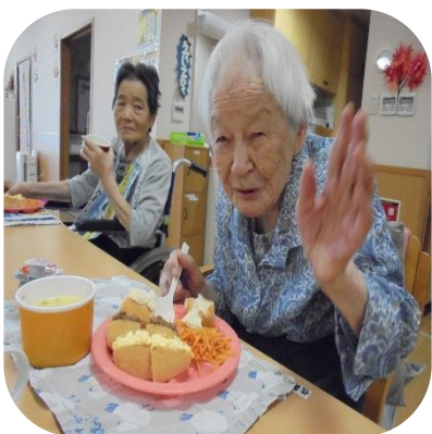
【パンバイキング（あやめ）】