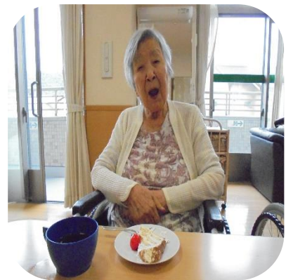
【おやつ作り（もみじ）】