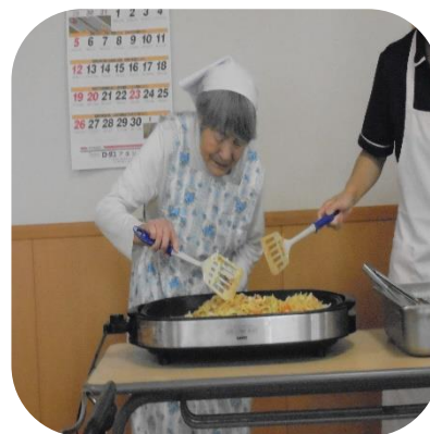
【ホットプレート調理（さくら）】