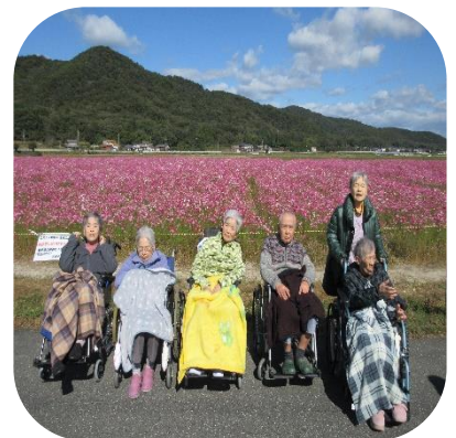
【馬場コスモス畑（さくら）】