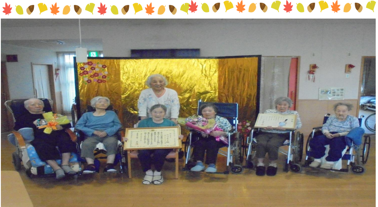
【 百寿の祝い（もみじ） 】

清秋の候、皆様におかれましては、ご健勝のこととお慶び申し上げます。 澄み切った秋空が清々しい季節となりましたが、朝夕の冷え込みには、冬将軍の到来も近いように感じますね。