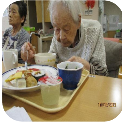
【寿司バイキング（あやめ）】