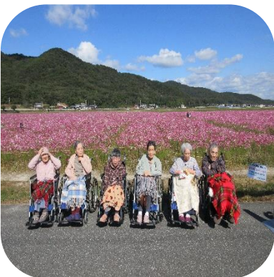
【馬場コスモス畑（あやめ）】