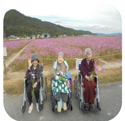
【馬場コスモス畑（もみじ）】