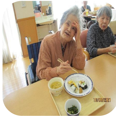
【寿司バイキング（さくら）】