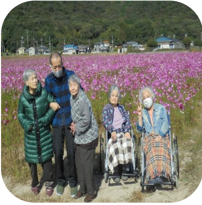
【馬場コスモス畑（さくら）】